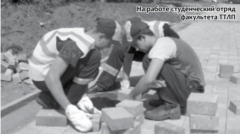
На работе студенческий отряд факультета ТТЛП

Лето 2012 года объединило в студотрядовское движение 750 юношей и девушек нашего университета. УП «Зеленстрой Ленинского района г. Минска», «ССУ–1 УДМСиБ Мингорисполкома», ДУП «ПМК–190» в г. Дзержинске, УП «Минское лесо-