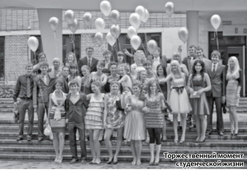
Торжественный момент студенческой жизни

— Не теряйтесь. В первые дни учебы вы наверняка будете чувствовать себя растерянными, а то и подавленными — все вокруг незнакомое, народу тьма, никому до вас нет дела. Пока вы плохо ориентируетесь в переплетенных коридорах, нумерации аудиторий, возьмите себе за правило выходить из дома на 10-15 минут раньше